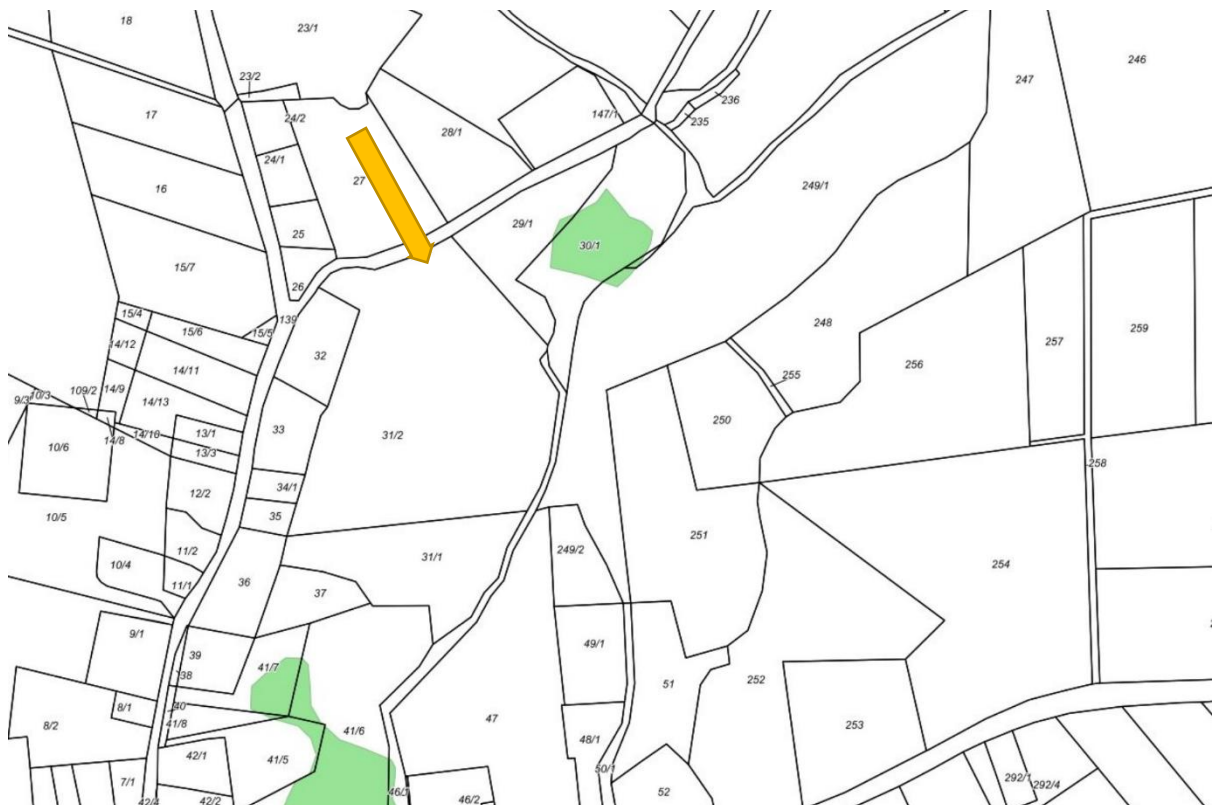
Abb. 1: Darstellung der gesetzlich geschützten Biotope im Umfeld des Plangebietes (Quelle: GAIA MV, unmaßstäblich). Der orange Pfeil verweist auf die Lage des Plangebietes.

Bild 1 zeigt, dass sich im Plangebiet keine auf Grundlage des § 20 NatSchAG MV gesetzlich geschützte Biotope befinden. Insofern ist eine Betroffenheit nicht zu